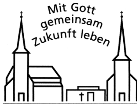
St. Laurentius · St. Urbanus